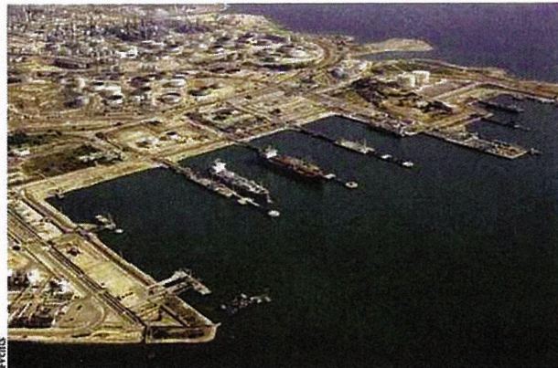
Le port pétrolier de Lavéra, qui offre 13 appontements, s'étend sur 33 hectares. Pour gérer la maintenance de tous les équipements présents sur le site, l'emploi d'une solution de GMAO s'est avéré indispensable.

l'éditeur a récemment lancé une application mobile, Carl Touch, qui offre la possibilité d'accéder au logiciel à partir d'un smartphone sur Android**. Grâce à cette solution, les techniciens de maintenance de Fluxel pourraient consulter la liste des interventions à réaliser, recevoir des informations complémentaires ou envoyer