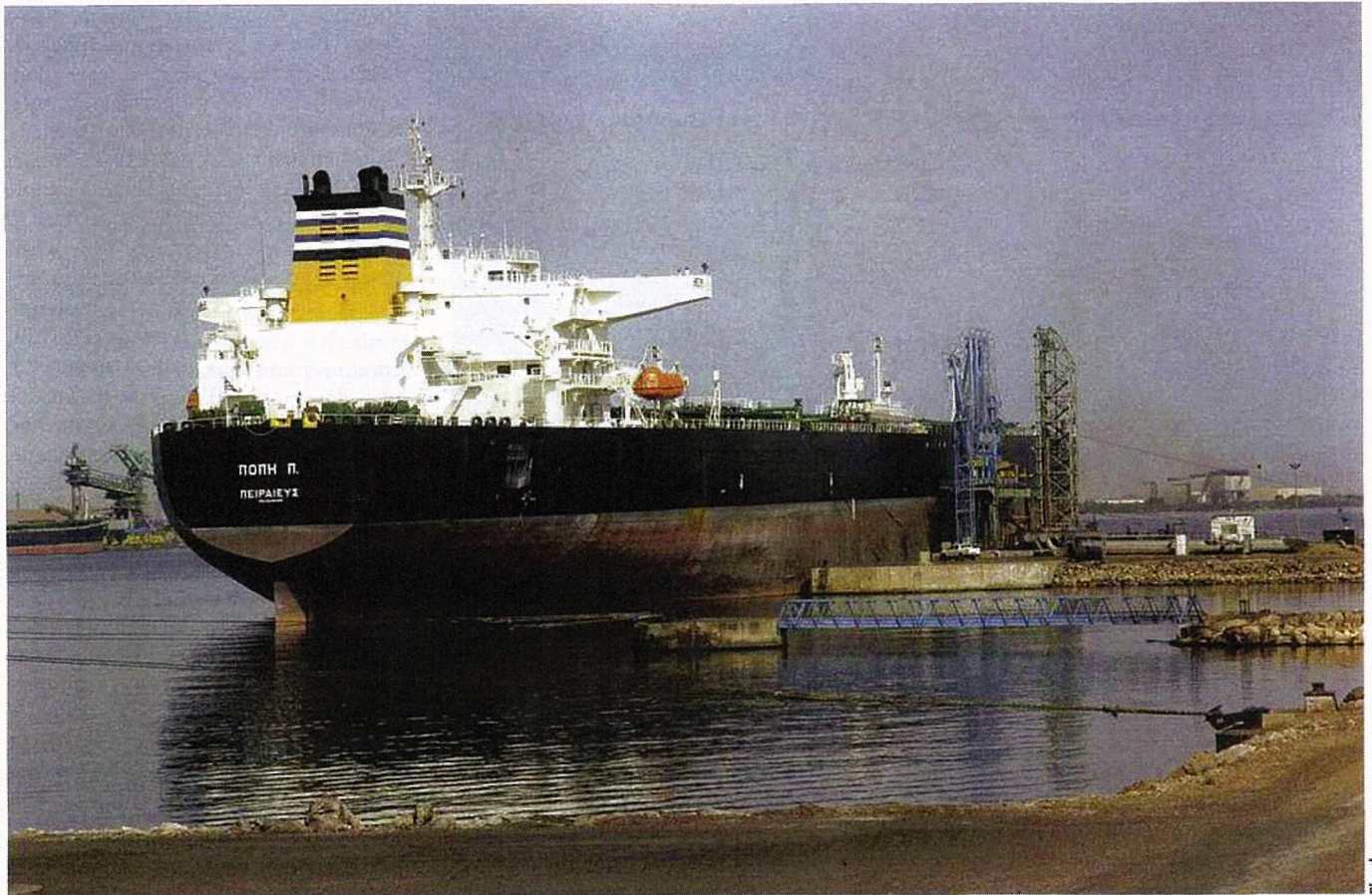
Depuis sa création en mai 2011, Fluxel est l'opérateur des ports pétroliers de Fos et Lavéra. Le terminal de Fos, qui dispose de sept appointements, accueille plus de 1 000 escales de navires par an. Parmi eux, les plus grands navires de brut et de produits raffinés.

est contraint de se recentrer sur ses fonctions régaliennes, et de se séparer des activités opérationnelles. Les terminaux portuaires sont alors confiés à différents opérateurs privés. Parmi eux, une nouvelle société, Fluxel, devient propriétaire de l'outillage des ports de Lavéra et Fos. Les