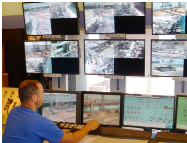
Desde el centro de control se supervisan las instalaciones de la terminal, zona de acceso restringido.

La terminal está dotada de brazos de carga y torres de acceso a los buques petroleros de más de 25 metros de altura, junto a diferentes sistemas de seguridad para el control de la contaminación por hidrocarburos, sistemas anclajes, más de 40 toberas controladas por sistema remoto, más de 100 bocas de incendio, red de incendio de más de 10 kilómetros, y varias estaciones de espuma en cada plataforma, entre otros. Y todo controlado desde el puesto de control.